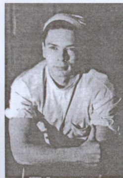
Молодой изобретатель, ученый, хирург-офталь- молог С.Н.Федоров в первые дни работы в Чебоксарах. 1959 г.