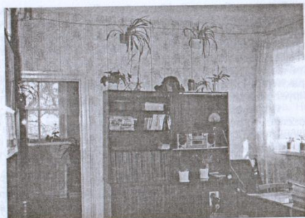
Квартира, где в 1959–1961 годах жил С.Н.Федоров. г. Чебоксары, ул. Сеспеля.